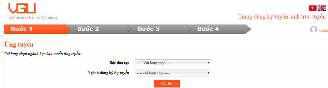
Hình 3. Ứng tuyển